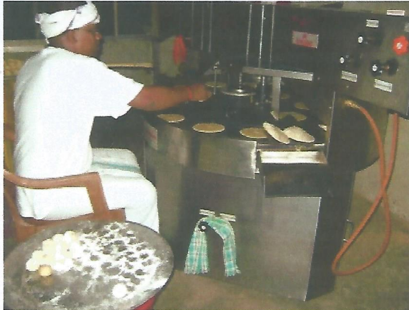
1000 rotis per uur maakt deze machine