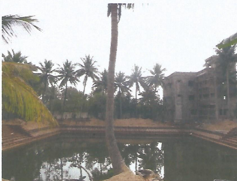
zwembad en kliniek bij Balashram

Op het terrein van de school is het zwembad in gebruik genomen. De verplaatsing van de keuken en de koeienstal zijn nog in een voorbereidende fase.