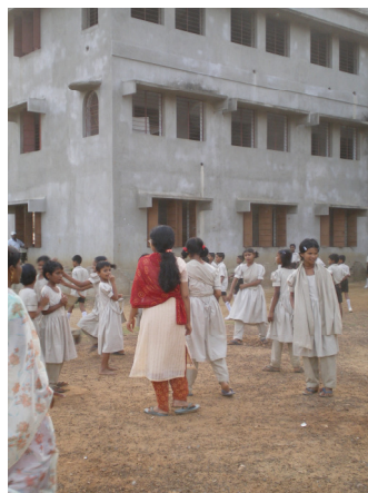
10-jarige meisjes met sportjuf

Er is een sportlerares aangetrokken voor de oudere kinderen en een sportveld met atletiekbaan is in de maak. Dagelijks zijn er activiteiten.