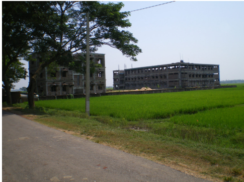
Appartementengebouw voor personeel en jongenshuis

Daarna wordt begonnen met de afwerking en het terrein. Ondertussen wordt er goed voor de kinderen gezorgd. De leerprestaties zijn goed; kinderen die moeilijk meekomen, krijgen extra aandacht.