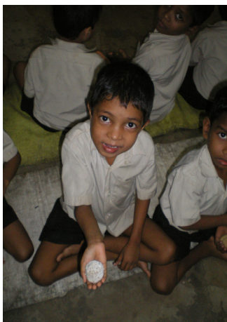
kijk eens wat lekker!

Van de melk die de 25 koeien geven, gaat een gedeelte naar een bakker. Die maakt er lekkernijen van waar de kinderen op hun beurt van genieten.